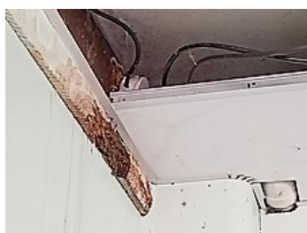
Infiltrations dans les salles de classe